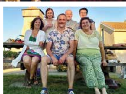
Les Falouzards présentent Le Blouson de cuir